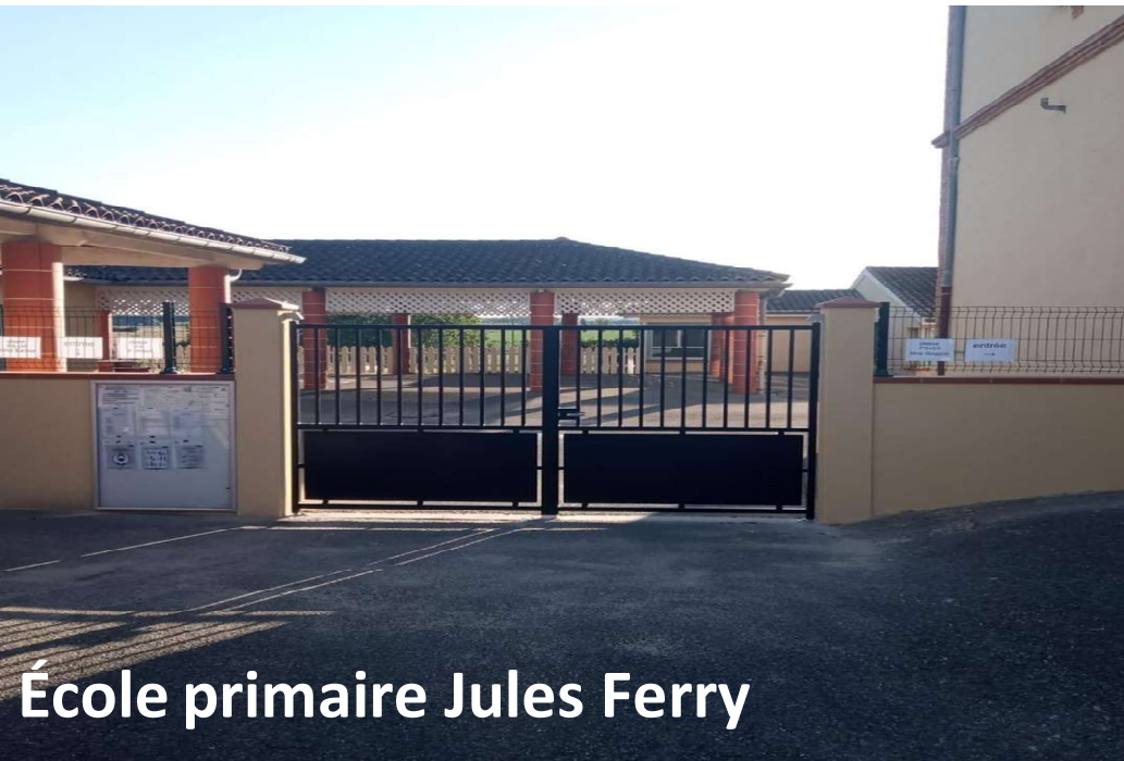
École primaire Jules Ferry