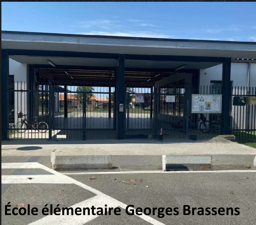
École élémentaire Georges Brassens